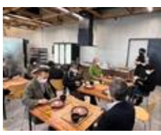
カフェコーナー 地元の食材で作る 軽食メニューも是非