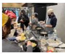
食工房 パイナップルケーキも ここで焼いています!