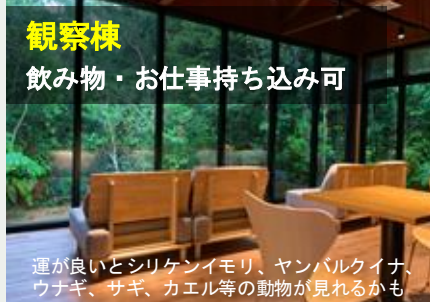
観察棟 飲み物・お仕事持ち込み可 観察棟 ラウンジスペース Nature lodge lounge space

【お願い】黄色バンドを 着けて入場してください 支援エリア(ブランコ・観 察棟)ご利用の際は「入場 リストバンド」をつけてく ださい(本体棟・物販レジ でお買い求めください) 大人340円 子供170円 ※ ※村民割あります