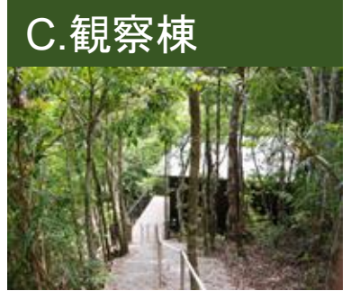
C.観察棟 24HLive配信中 やんばる生き物 カメラ設置エリア

希少動物のシリケンイモリも沢山います ヤンバルクイナも住む谷で小動物や 野鳥を眺めつつ、巣箱などを設置し 自然との共存を目指しています。