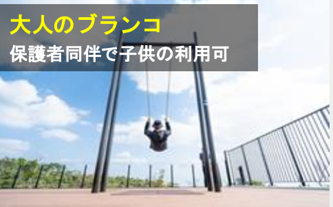
大人のブランコ 保護者同伴で子供の利用可 やんばるの丘ブランコ (階段上) Yambaru hills swing (Upstairs)

支援エリア (入場料は森林散策路など運営に役立っています) やんばるの鳥の声や自然の風を感じながら、 ただのんびり過ごすだけのある意味“贅沢”な場所です