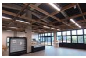
物販コーナー やんばるエリアの品物を 重視して集めてみました